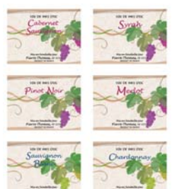
●白砂博大さんの作品